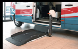
Fiorella Lift an der Seitentür.